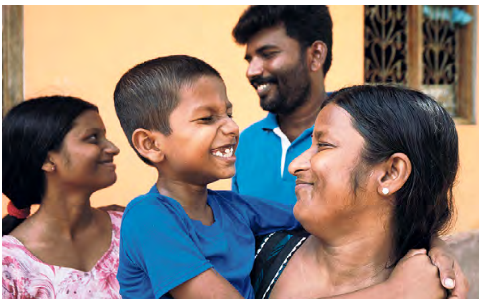
De nieuwe winkel is het leven van het gezin aan het veranderen.

Met steun van de H&M Foundation helpt CARE vrouwen in arme gemeenschappen met ondernemingstrainingen en kapitaal, om een bedrijf op te starten of uit te breiden. Vrouwen worden getraind in wat ze nodig hebben, bijvoorbeeld op het gebied van sales, algemene businessvaardigheden en financiën. Zo verbeteren ze zelf hun toekomst – en die van hun omgeving.