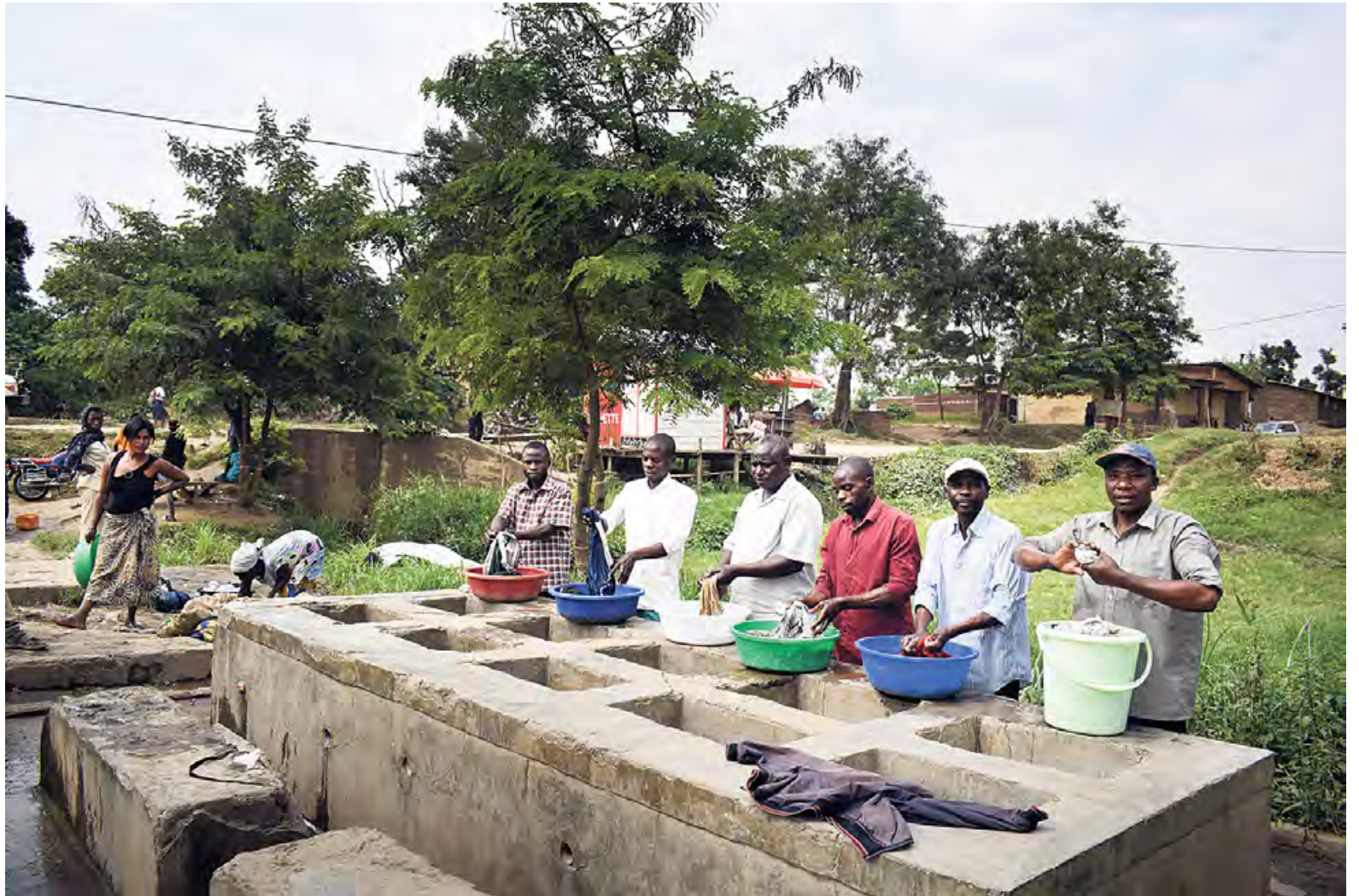
In reflectiegroepen worden mannen zich ervan bewust dat gendergelijkheid ook in hun voordeel werkt.