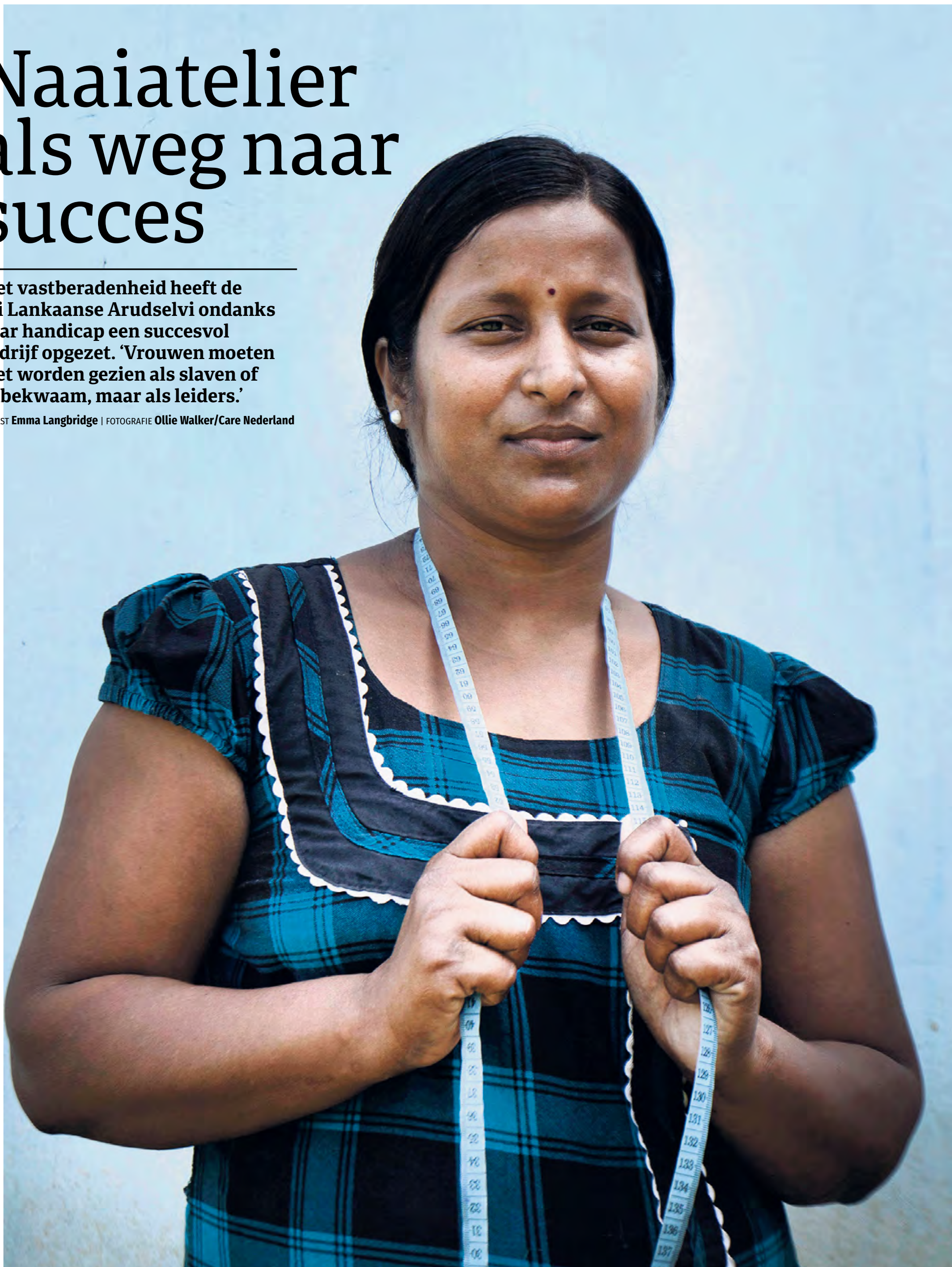
Arudselvi: 'Vroeger zagen de mensen mij als de arme vrouw die haar been verloor. Nu zien ze me als een zakenvrouw met een naaiatelier.'

► TEKST Emma Langbridge