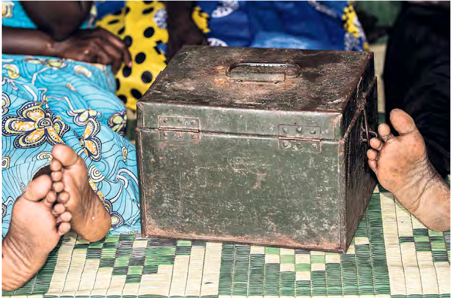
Als enkele vrouwen of mannen succesvol ondernemen, profiteert de hele gemeenschap daarvan. Vooral vrouwen investeren veel in hun familie en naaste omgeving.

Neem bijvoorbeeld het project waarbij de bestaande sociale onderneming African Clean Energy, die ook een vestiging in Nederland heeft, gelinkt is aan deelnemers van spaar- en leengroepen in Oeganda. CARE faciliteert wereldwijd meer dan 300.000 van dit soort groepen. Deelnemers brengen zelf kapitaal bijeen en kunnen tegen een lage rente lenen. Voor het ingelegde spaargeld ontvangen deelnemers een kleine rente. Een doel van deze groepen is de toegang tot financiering voor zowel zake lijke als huiselijke aangelegenheden te vergroten. De sociale ondernemingen waarmee wordt samengewerkt, leveren duurzame, groene producten. African Clean Energy (ACE) heeft hybride kooktoestellen ontwikkeld waarbij een zonnepaneel zorgt voor opwek-