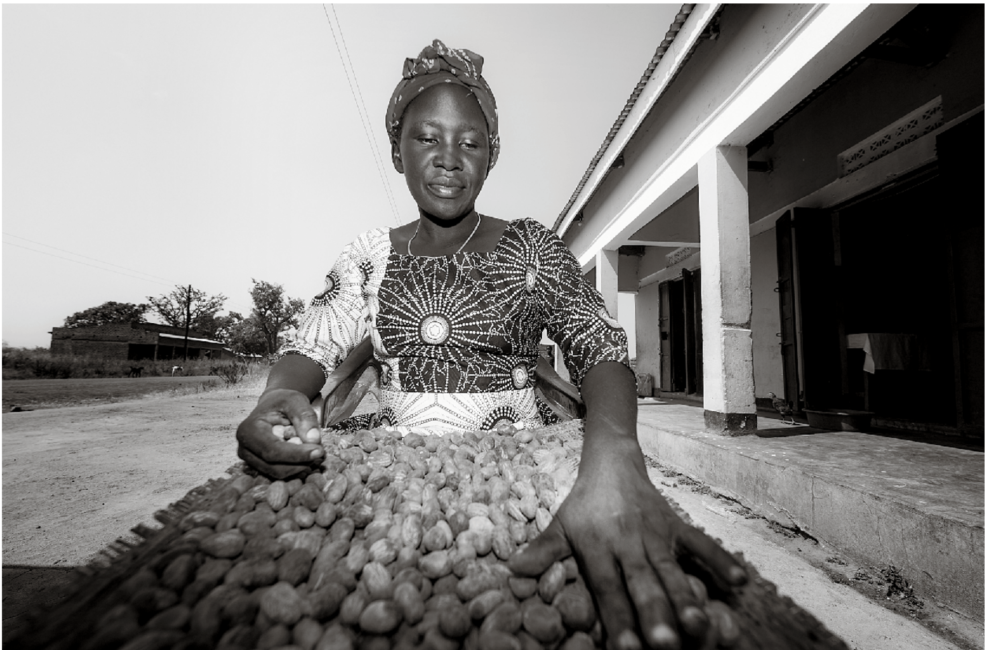
Eerst werden de bomen gekapt voor brandhout, nu zien mensen dat het meer oplevert als je de bomen laat staan en de noten oogst.