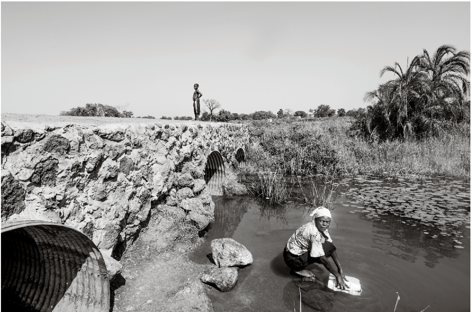
De wetlands zijn kwetsbare moerasgebieden die in Oeganda relatief veel voorkomen en die van essentieel belang zijn voor de bevolking.